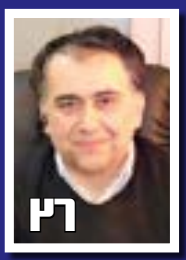
ارتقا تکنولوژی سخت‌افزاری و نرم‌افزاری اکتشاف پستوانه فردای معادن