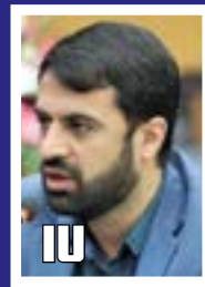
سهم ایران از بازار ۲۳۰ میلیارد دلاری روسیه افزایش می‌یابد