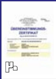
ذوب آهن اصفهان گواهینامه همولوگیشن را دریافت کرد