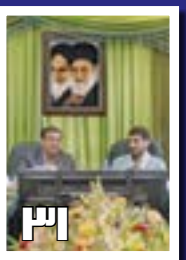
فولادمار که و ذوب آهن در مسیر تحقق حداکثری شعار سال