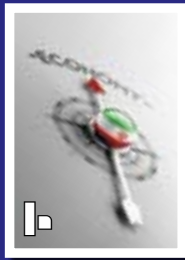
ایران چهاردهمین اقتصاد جهان شد