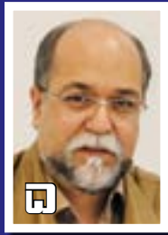
چادرملو در آستانه تحول جدید