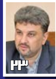
معاقبت ۵۸۰ هزار واحد صنعتی از برنامه‌های مدیریت مصرف برق