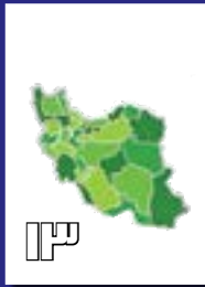
جزئیات اجرای طرح آمایش سرزمین