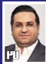
جزئیات پیشرفت طرح‌های توسعه فولاد غدیری نی‌ریز