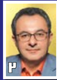
نقشه راه اقتصاد نوین کشور