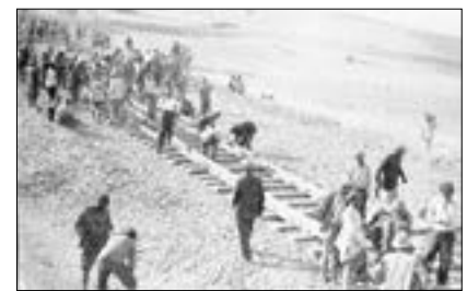
برای ساخت راه‌آهن سراسری در ایران به کارخانه ذوب‌آهن نیاز بود که وجود نداشت و به ناچار کار با ریل‌های وارداتی شروع شد