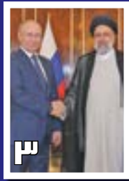
سفر پوتین به ایران؛ نمایی از یک ائتلاف استراتژیک