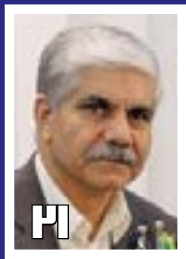
جزئیات طرح‌های توسعه جهان فولاد سیرجان