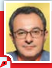
علی رجیبی ابهری مدیر مسئول

سهم بخش معدن در تولید ناخالص داخلی کشور در حالی همچنان کمتر از یک درصد عنوان می شود که این میزان توانمان با بخش صنعت تقریباً یک چهارم GDP کشور محاسبه شده و حتی با اضافه کردن بخش خدمات به آن، سهم آن را تا ۴۰ درصد مجموع درآمدهای ناخالص داخلی کشور ارزیابی می کنند و برای این حوزه اشتغال ۴۵ درصدی هم در نظر گرفته می شود.