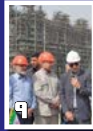
سفر دکتر قالیباف، رئیس مجلس به گجساران