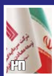
ورود جدی تر به بخش معدن