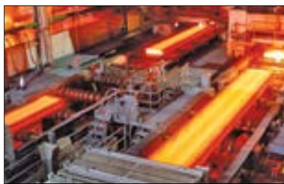
ذوب‌آهن اصفهان توسط کارشناسان شوروی ساخته شد و در دهه‌های بعدی توسط مهندسان ایرانی توسعه یافت

بعدها در دوره مظفرالدین قاجار در سال ۱۲۷۹ شمسی دوباره یک کارخانه ذوب‌آهن در ایران تأسیس شد که داستانش این بود: «مرتضی قلی‌خان صنایع‌الدوله، داماد مظفرالدین شاه و نخستین رئیس مجلس شورای ملی یک