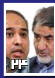
مناظره آل اسحاق و خبصران