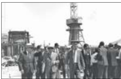
عکسی از نخستین روزهای افتتاح کارخانه ذوب‌آهن اصفهان