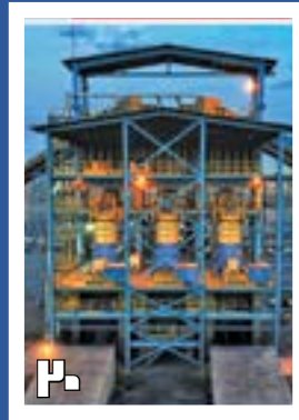
توسعه؛ سیاست راهبردی گهرزین