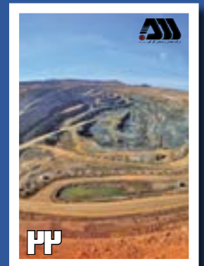
گل‌گهر؛ چالش‌ها، دستاوردها و موفقیت‌ها