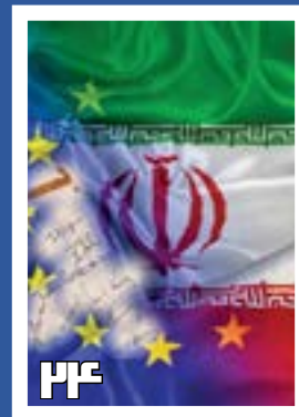
آخرین وضعیت برجام