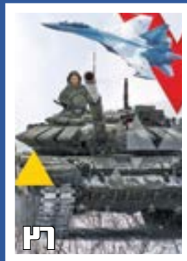
آتش در اوکراین؟ دامن همه را خواهد گرفت؟