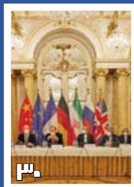
سرنوشت برجام در ماریپچ کانون‌های بحران بین‌المللی